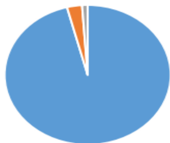
Broj djece smrtno stradalih i nestalih hrvatskih branitelja